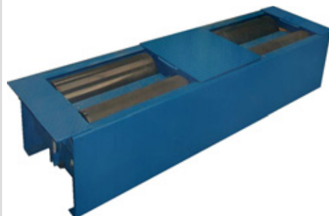
Fig. 2.- Banco neumático de rodillos libres.